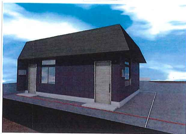
《外観》 完成イメージ