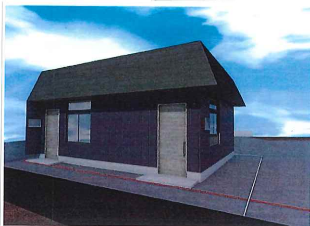
《外観》 完成イメージ